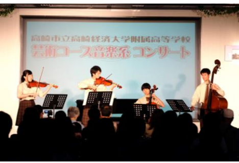
▲弦楽器の四重奏を披露

今年で4年目を迎えた芸術コース音楽系コンサートは LABI 高崎4階の LABI Gate で開催され、第一部では音楽系生徒の選抜者によるクラシックコンサート、第二部では家族向けの曲を演奏するファミリーコンサートが行われた。第一部のクラシックコンサートでは1年生から3年生の中から選出された8人