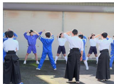
▲中学生に弓道の型を教える

午後に行われた部活動体験では野球部、サッカー部など7つの運動部の練習に中学生が参加し、高校での学校説明会では須永校長による学校説明や文理オナー生徒によるオナークラスの概要などが発表され、参加者は真剣なまなざしで説明を受けていた。今回のこの行事には市内外から約600人の中学生や保護者が訪れ、初回と合計して総参