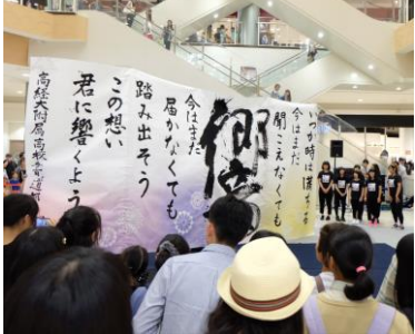
▲完成した作品を観客に披露

した」と当日を振り返った。なお今回のパフォーマンスで完成した作品は11月24日(火)まで専門店街1階セントラルコート吹き抜け部分に展示されている。今年でオープン9年目を迎えたイオンモール高崎は「地域の人々を中心となつて作るイベント」をテーマとして、県内の高校や観光局を主としたイベントを行