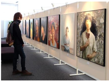
▲表現力の高い自画像が並ぶ

例年同所で行われている本校芸術コース美術系の作品展が本年度も開催され、会場には美術系生徒の力作である絵画や彫刻が一面に展示された。出展された作品は1年生から2年生の生徒40人の作品43点で、来場者は生徒たちの高い技術力や表現力に魅了されていた。