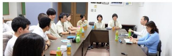
▲第2会議室で行われたディスカッションの様子

報」を知るため、本校生徒 会と情報交換を目的とした ディスカッションを行った。 ディスカッションは委員 会の方が質問したことにつ いて生徒が答え、そこから 議題を発展させるフリート ーク形式で行われた。その 内容は「最近流行している アプリ」や「Twitter上