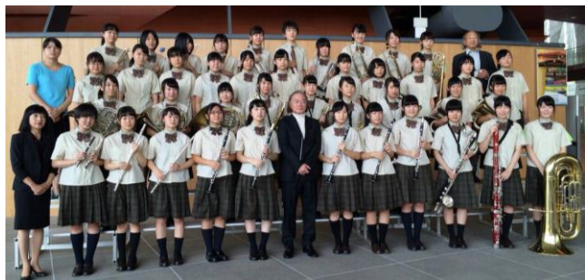
▲演奏を終えた後の姿

9月21日(月)、新潟県のりゅうとぴあ新潟市民芸術文 化会館において第21回西関東吹奏楽コンクール高校B が行われ、本校吹奏楽部が見事銀賞最高点を獲得した。