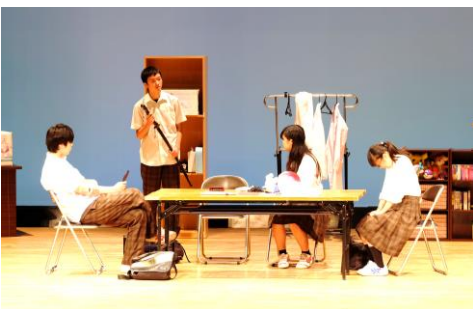
▲観客を魅了する演技

マは人を呪うというシリア スな物語となっているが、 内容には観客を笑いに誘う 場面もあり、登場人物一人 ひとりの性格や心情を演技 で巧みに表現していた。結 果は残念ながら優秀賞に至