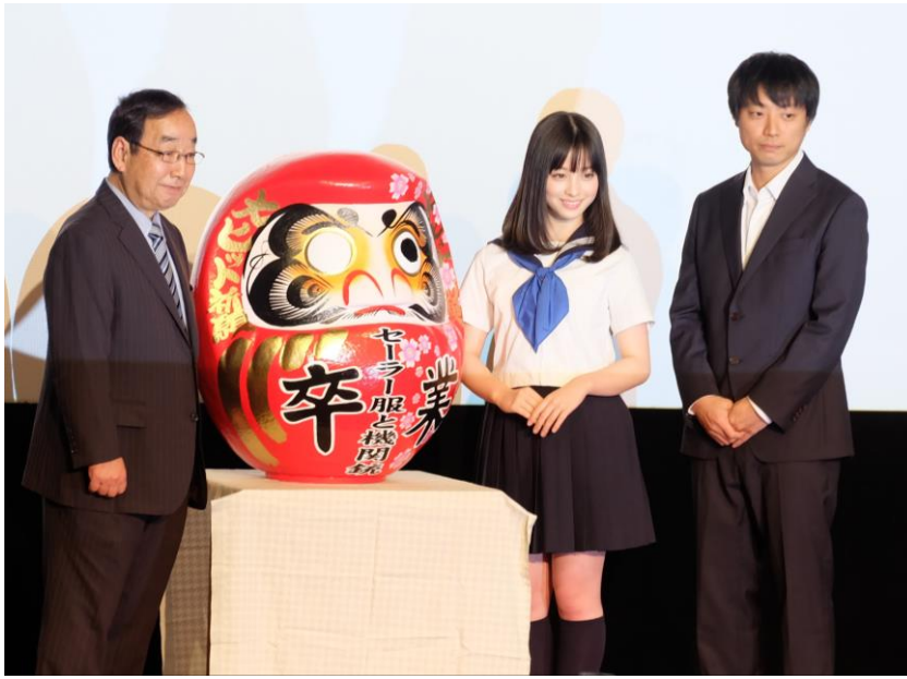
▲映画大ヒットを祈願し、高崎だるまに眼を入れた 左から富岡賢治市長、高崎だるま、橋本環奈さん、前田弘二監督

2月6日(土)に高崎ビューホテルで映画「セーラー服と機関銃—卒業—」の記者会見が開かれ、その後、高崎電気館で本作の試写会が行われた。